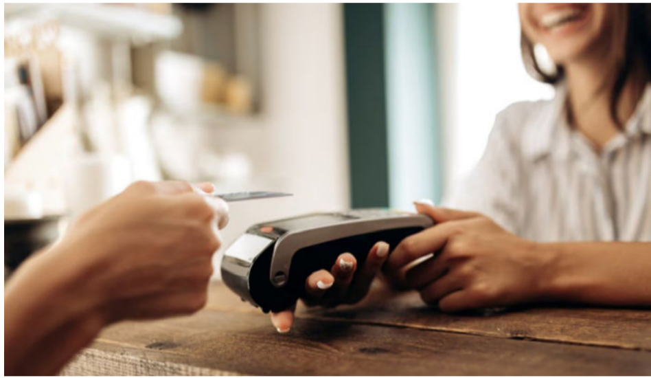
ahorro en dólares tradicionales

Asimismo, las tarjetas de débito que funcionen en dólares deberán vincularse a cuentas denominadas en esa moneda. Las cuentas CERA, diseñadas específicamente para el blanqueo de capitales, estarán excluidas de este sistema de pagos, lo que obligará a los usuarios a transferir fondos desde estas cuentas a cajas de