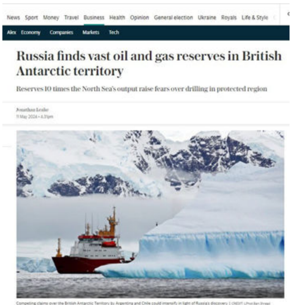
Competing claims over the British Antarctic Territory by Argentina and Chile could intensify in light of Russia's discovery

Las exploraciones en busca de hidrocarburos son moneda corriente desde hace décadas. Sin embargo, en la Antártida, estas actividades no están permitidas: en 1959 se firmó el Tratado Antártico, un compromiso que, a fin de preservar la paz, prohíbe cualquier exploración y explotación de recursos de este tipo en el continente blanco. Este documento de cooperación científica --que entró en vigencia en 1961-- fue firmado por Argentina, Australia, Bélgica, Chile, Estados Unidos, Francia, Reino Unido, Japón, Nueva Zelanda, Noruega, Sudáfrica y