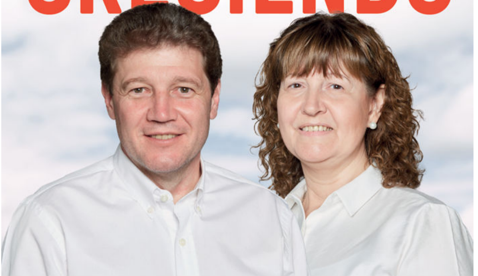
GUSTAVO MELELLA GOBERNADOR