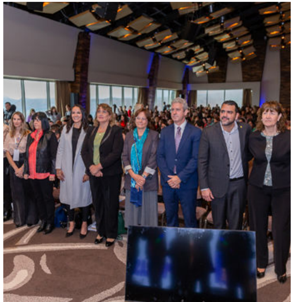
figura del Abogado del niño; la creación del Programa de atención integral a pacientes oncológicos infanto-juveniles y la creación de la defensoría Provincial de los Derechos de niñas, niños y adolescentes, entre otras normas.

Cabe mencionar que, desde el Parlamento, se sancionaron durante el último período, leyes relacionadas a la temática abordada, como la norma que crea en el ámbito de la Provincia, la