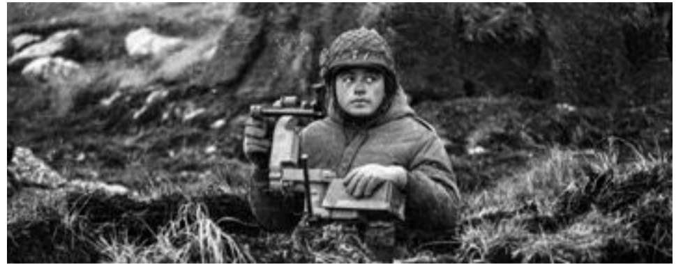
2 de abril. Tras el acto, pasada la 1 de la mañana, junto a los sindicatos del petróleo, se compartirá el “locro Malvino”.

Frente a la playa, donde se emplaza el monumento, a las 22.30 se realizará el simulacro de la “operación Rosario”, a cargo del BIM N° 5, en memoria de los caídos en Malvinas y como una de las actividades emblemáticas de la jornada, esperando el