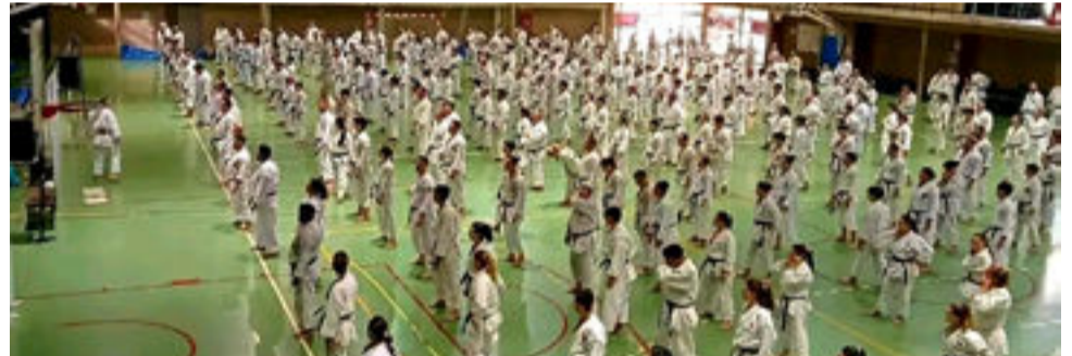
Se realizó en Bs As los días 24, 25 y 26 de marzo, el curso de instructores, selectivo y perfeccionamiento de