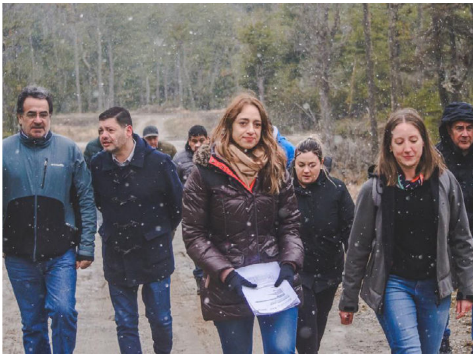
llo Territorial y Hábitat de la Nación, “podimos seguir avanzando y cumplimentando la documentación correspondiente para posibilitar la licitación de las viviendas multifamiliares”, finalizó el funcionario.