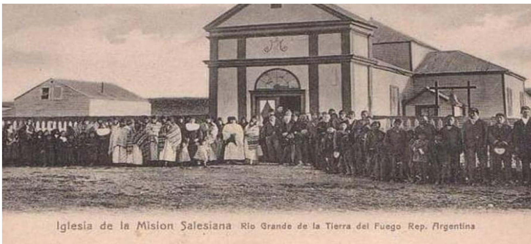
Iglesia de la Misión Salesiana Río Grande de la Tierra del Fuego Rep. Argentina

Pero lo que es un hecho es que Ushuaia, al otro lado de la isla, lejos de las rutas seguidas, apenas visitada por los buques nacionales y por una que otra embarcación que se atreva a entrar en los canales, con sus comunicaciones por tierra interrumpida en todo el invierno por la nieve, dejará bien pronto de ser capital, pues que el Gobierno Nacional, debe hacer sentir su influencia allí, en el Norte, en el foco de la producción fueguina, donde están las estancias, verdadera y perdura-